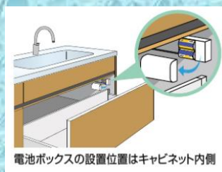
電池ボックスの設置位置はキャビネット内側